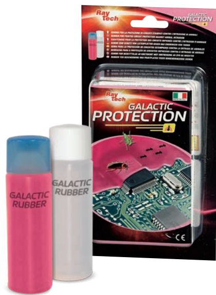
Composição do kit: 2 tubos de produto bicomponente

Kit para ligação, manutenção e proteção dos sistemas elétricos